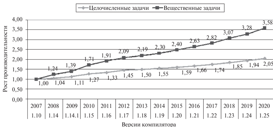
Рисунок 1. Зависимость производительности микропроцессоров «Эльбрус» от оптимизаций компилятора

Анализ результатов ведущейся сейчас работы по развитию компилятора показывает, что производительность микропроцессора «Эльбрус-16СВ» на целочисленных задачах вырастет на 20%, а на вещественных – на 35%. Кроме того, оптимизация важнейших библиотек с использованием Ассемблера увеличит их производительность в 3–5 раз, что даст дополнительный прирост производительности прикладных программ на платформе «Эльбрус».